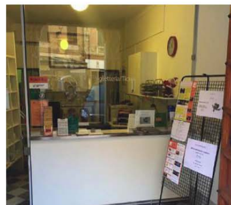
CAMBIAMENTI l'ufficio turistico si è trasferito e si potranno acquistare anche i biglietti per il museo cittadino

SESTRI LEVANTE (gbc) Durante le festività natalizie alcuni cittadini si sono lamentati per la chiusura dell'ufficio di informazioni turistiche. In realtà l'ufficio non è stato chiuso ma semplicemente si è trasferito in largo Colombo. Mediaterraneo Servizi, che gestisce il servizio, ha infatti preferito unire l'ufficio informazioni con la biglietteria del Musel presso palazzo Fascie. Oltre al materiale informativo sulla città sarà dunque possibile acquistare i biglietti del museo cittadino, ottenere le tessere per il bike sharing e le info per la rete pubblica wi-fi. La nuova sede di largo Colombo, già attiva dall'inizio dell'anno, riunisce diversi servizi e permette un risparmio sui