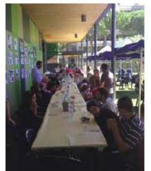
LA LUCE DI UN GESTO

per la realizzazione di progetti di solidarietà. Un'iniziativa che ogni anno ha sempre più successo, con associazioni, parrocchie, circoli e scuole che danno vita ad un gran numero di eventi benefici. L'appuntamento più vicino è per venerdì 27 gennaio. L'associazione "Civitas Umana per la Fraternità" ha organizzato una cena di solidarietà nel lungomare di Sestri. Il ristorante il Gourmet infatti ha preparato una cena a base di pesce e all'incirca metà del costo della cena sarà devoluto in beneficenza.