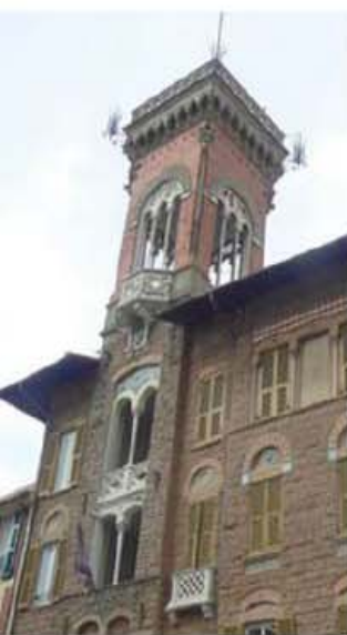
IL MUSEL di sestri

bero investiti in attività che coinvolgono maggiormente cittadini e turisti. Conti infine fa una lista delle persone che di solito visitano il museo durante l'anno: «La gente che vi entra è così suddivisa: curiosi (pochi), qualche turista che, incantato dagli opuscoli e dalle brochure, pur di fotografare qualcosa, entrano ad annoiarsi, comitive di scolaresche costrette a sorbirsi immagini di qualche rana preistorica del lago di Bargone, tanto per fare punteggio ed aumentare presenze».