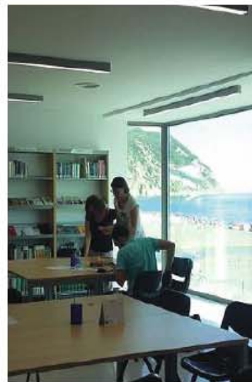
LIBRI E MARE A RIVA i due centri non chiuderanno per la pausa estiva ma garantiranno i servizi di luglio e agosto, cosa mai avvenuta prima